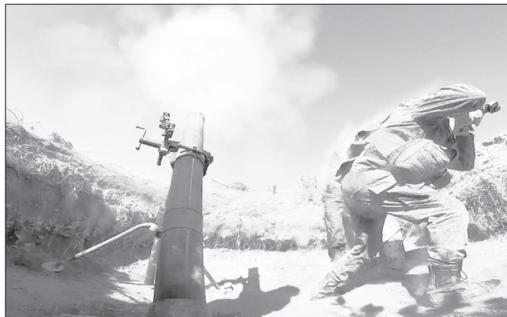
Бойцы отряда "Барс-12" регулярно проводят разведку, держат оборону и наносят удары по позициям украинских националистов

- Помню, стояли на укрепе, в окопе, смотрим - а чуть дальше как будто старый рубеж. Начал копать - нашли гильзы времен Великой Отечественной. То есть там же землю свою защищаем, где и наши бойцы стояли. Так же как и их, нас спасает наша русская природа. Однажды ошиблись по карте и попали под перекрестный огонь. И тут снег повалил - густой такой, мы почувствовали, что враг потерял нас, и смогли уйти. А потом в одном из поселков на этом свежем снегу увидели лепестки еще цветущих тюльпанов - красных, желтых. Как память о погибших, - говорит "Глыба".