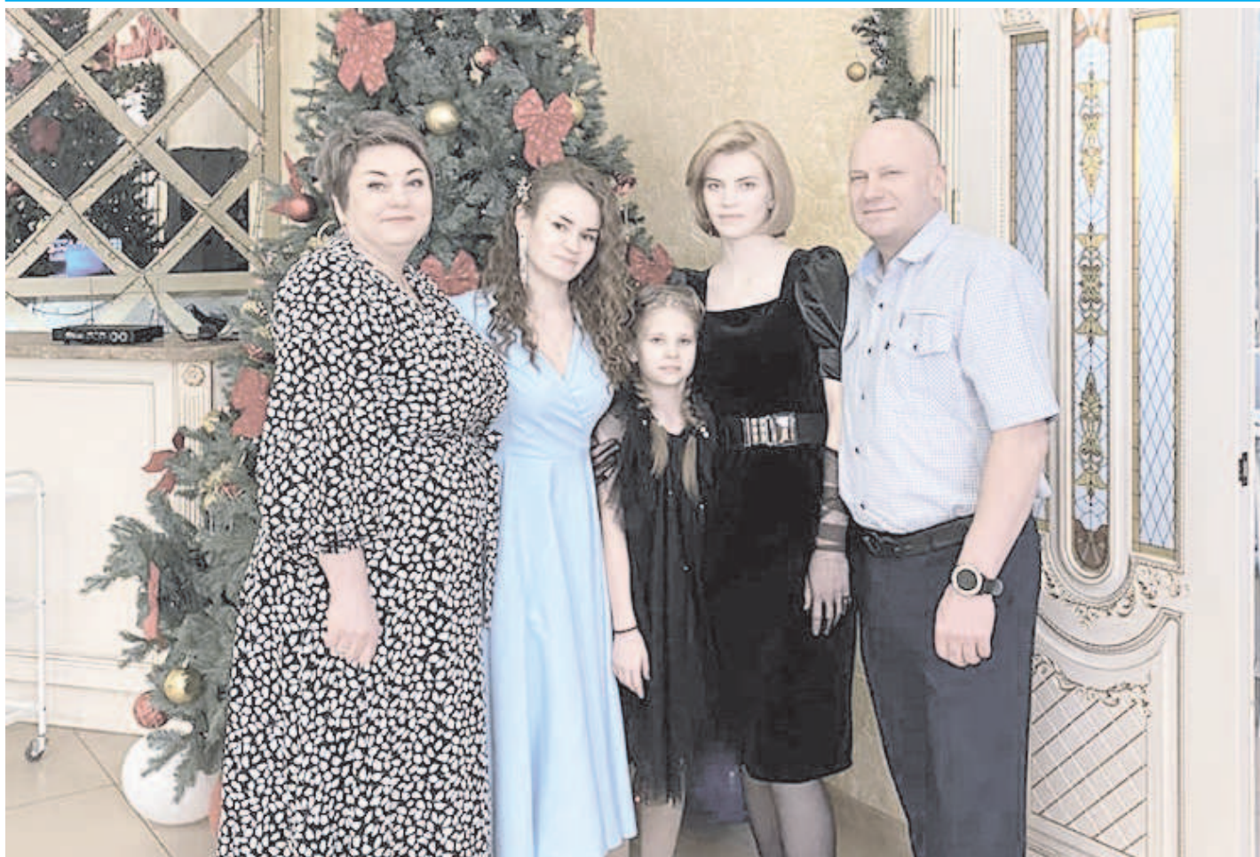
МИР ВАШЕМУ ДОМУ