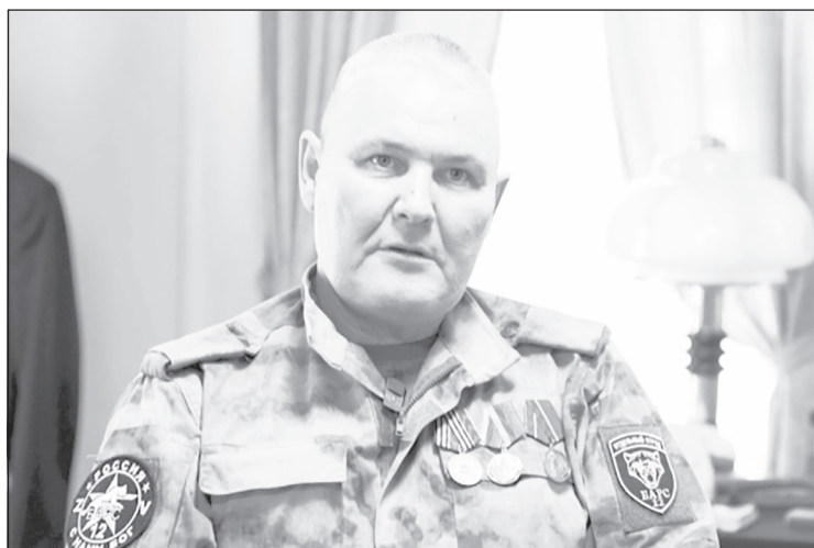
"Глыба": мы русские, а Россию никто и никогда не победит

По словам "Глыбы", самое важное для командира - хладнокровие.