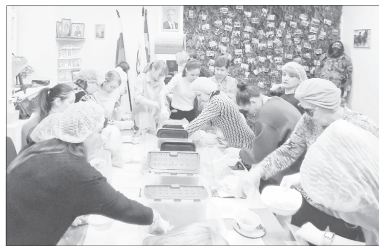
Производство сухого борща в Ханты-Мансийске

- Технология сухих супов нами уже отработана: подобраны ингредиенты, выверены пропорции, время сушки, удобная упаковка.