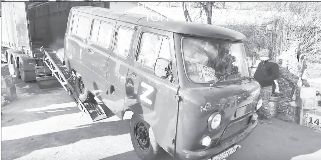
Помощь от неравнодушных жителей Ханты-Мансийска - от посылок до машин

За посылками военные приехали из разных подразделений со всех участков фронта, в том числе из госпиталей: для зоны СВО югорчане регулярно собирают "медицину".